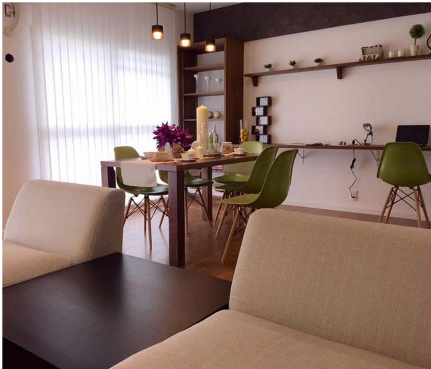
עיצוב וצילום: קארין קודה לוריא