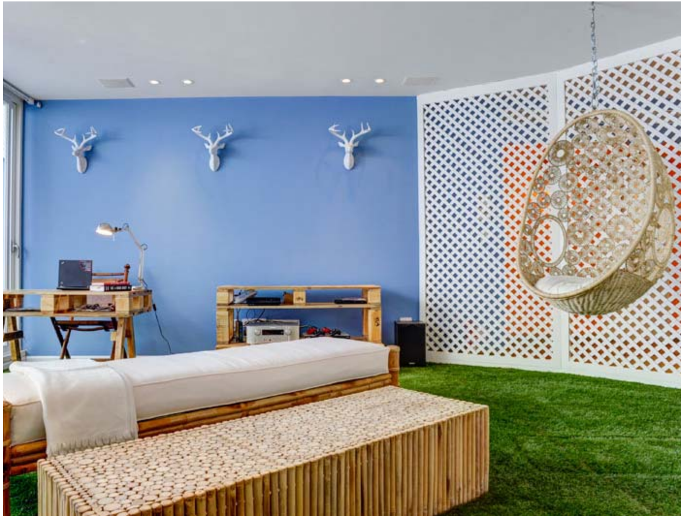
עיצוב: שני רינג