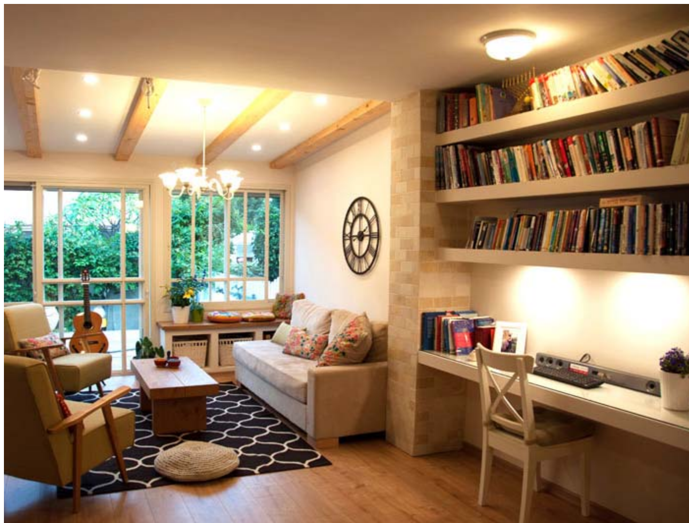
עיצוב וצילום: גלית אשמן