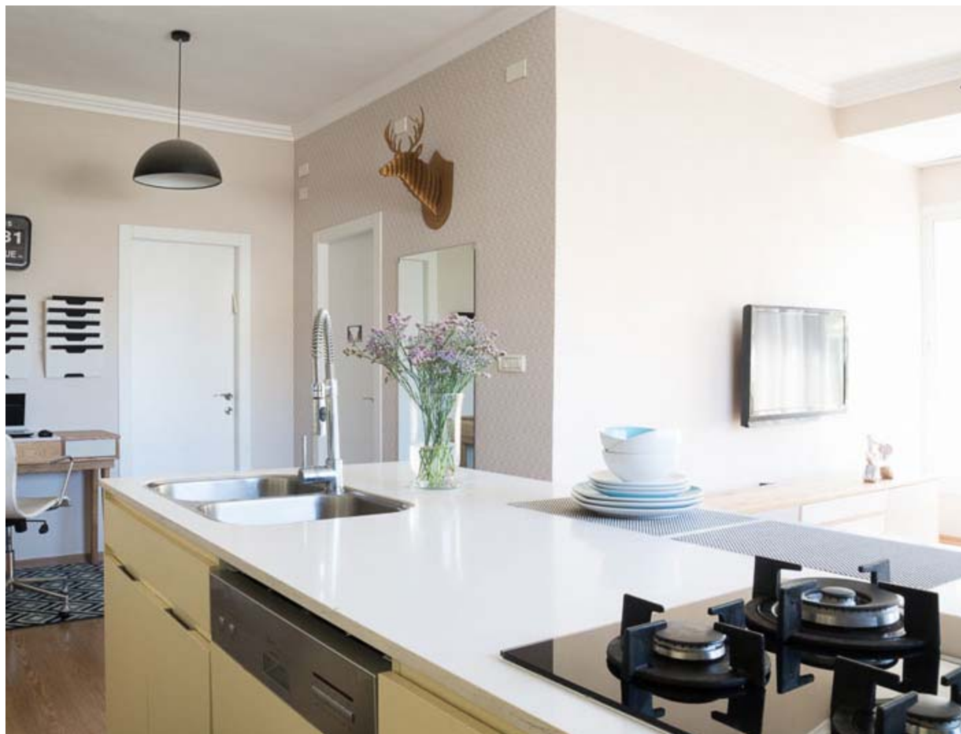
עיצוב: יונית שטרן

הרעיון התכנוני בדירה הקטנה היה ליצור מרחב שבו גם מי שעובד או מבשל, יכול להיות בקשר עין עם מה שקורה בסלון, לאפשר פינה שקטה ומסודרת, שבה ניתן יהיה לעבוד. בעזרת העיצוב נוצרה אחידות בבחירת הפריטים והצבעים שבחלל, והקטן יש בדירה תחושה מרווחת.