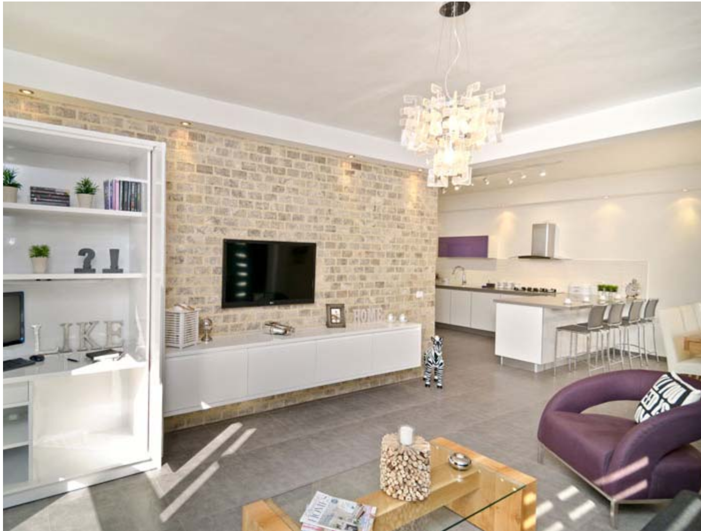
עיצוב: לילך וואנו בן יצחק