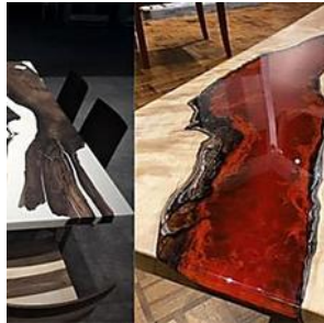
הנבחרת שלנו למונדיאל: השולחן שתמיד חלמתם עליו מחכה לכם