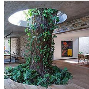
עץ ומסביבו בית: בתים שמזמינים עצים