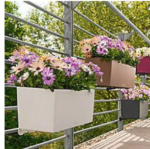
הרבה מעבר לגינה: תנו אופי לגינה הפרטית שלכם