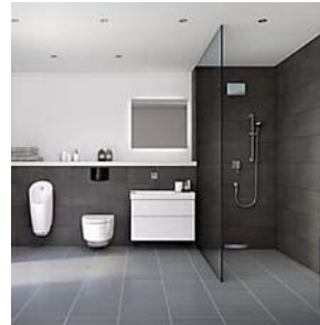
שש שקט בצנרת: אקוסטיקה במערכות המוצרים הסניטריים