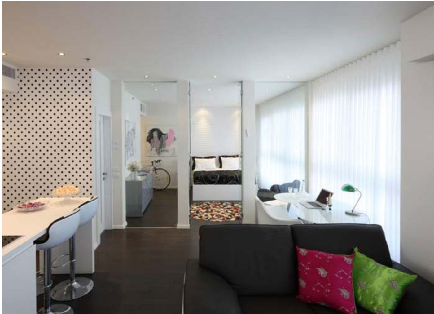
עיצוב: זיוה גורסקי, צילום: עוזי פורת