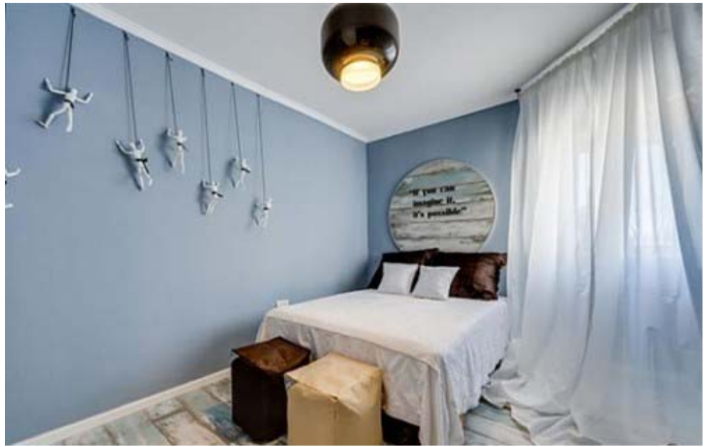
חדרו של החייל אחרי השיפוץ