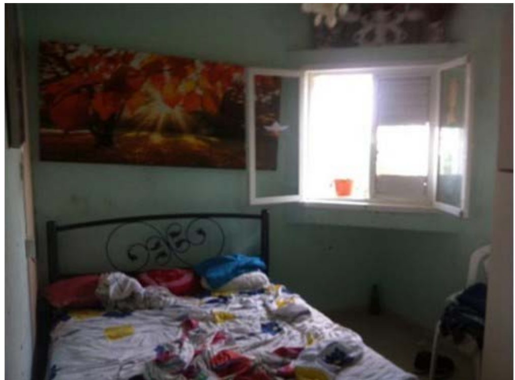
חדרו של החייל לפני השיפוץ

החייל דניאל גדמו המשרת בהנדסה קרבית, נולד באתיופיה, התחנך בבסיס צבאי ועלה לארץ לפני 14 שנים. דניאל, מצטיין באומנות הלחימה קונטאצ'י קראטה, דבר שהיווה את ההשראה לחדר. הצוות עמית קדר, ענת סינואני וקארין טפר בחרו להמחיש את הקונספט בחדר ע"י התנועתיות הבאה לידי ביטוי בדמויות המקבילות לדמויות מהקראטה המסמנות תנועות שונות מעולם אומנויות הלחימה ובעיגול המסמל את סגירת המעגל שדניאל עבר בחייו. בנוסף, הצבע התכול מעושה והקרניזים הלבנים מזכירים במעט תחושה אירופאית ומעניקים לצבעוניות תחושה בוגרת.