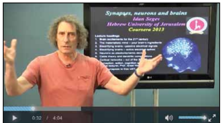
Synapses, Neurons and Brains: The Hebrew University of Jerusalem [Coursera]

בשנות ה-60 ניטש בארץ ויכוח ציבורי על הפעלת שידורי טלוויזיה בישראל. כדי להתגבר על ההתנגדות למדיום המאיים, הושקו תחילה שידורי הטלוויזיה הלימודית. כוכבי התכניות היו מורים שעברו הכשרה מיוחדת לעמידה מול מצלמה. שיעורי המתמטיקה והאנגלית לילדי ישראל הכשירו את הקרקע להקמת הטלוויזיה הישראלית, וכך זכינו בכל יום מחלה בבית לפגוש את דני מחשבון פשוט ולשיר את Susie surprise. בבתי ספר רבים הותקנו טלוויזיות בכיתות וכולם היו מרוצים - התלמידים, שבמקום "ללמוד באמת" צפו יחד בנפלאותיה של מיס קפלן בחנות הכולבו של מר גולן, והמורות (כבר אז כמעט שלא היו מורים גברים), שבמקום להתמודד עם הכיתה