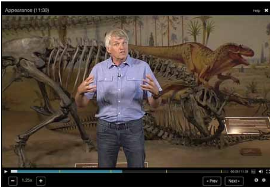
Dino 101: Dinosaur Paleobiology; University of Alberta [Coursera]

האוניברסיטאות, ולנו בתוכן. אנחנו כן יודעים יותר ממה שידענו כשהעסק היה בחיתוליו, ואני חושבת שסיכום הביניים שלנו מפתיע לטובה. מסקנה משמחת ראשונה היא שהוראה מקוונת הינה דבר מלהיב! חלוצי ההוראה המקוונת העלו על נס את הנגשת ההשכלה הגבוהה ואת תהליך הגלובליזציה שהיא מאיצה. הגישה ההתחלתית שלי לעניין הזה הייתה חשדנית. זה לא שחשבתי שהתמונות של צעירים אפריקאים יושבים מול מחשב הן מפוברקות, אבל בהחלט חשבתי שהן שם בעיקר למטרות של יחסי ציבור. החשדנות הפכה להתלהבות במהלך הקורס הראשון שהצענו, ואם צריך להצביע על רגע מכוון אחד, זה היה כשראיתי את המפה. הקורס הראשון שהציעה