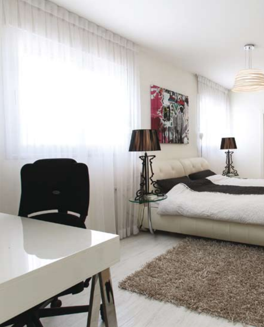
סוויטת השינה. צבעי החדר הם שילוב ניגודי של לבן, שחור ומעט נירוסטה