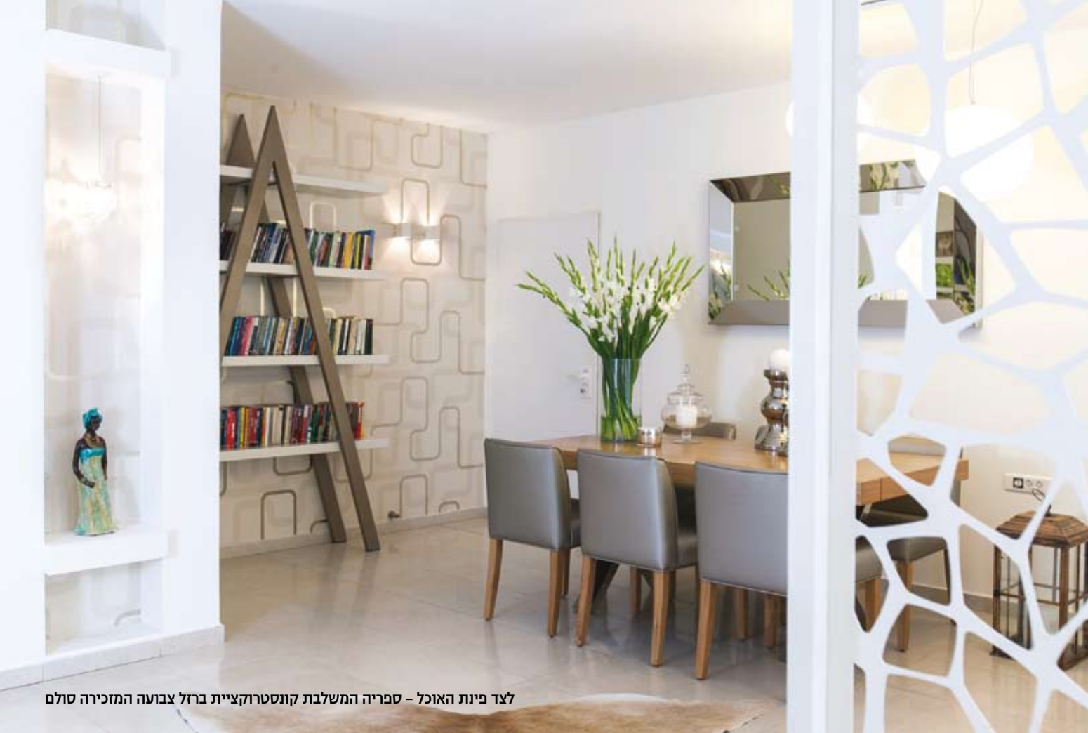
לצד פינת האוכל – ספרייה המשלבת קונסטרוקציית ברזל צבועה המזכירה סולם