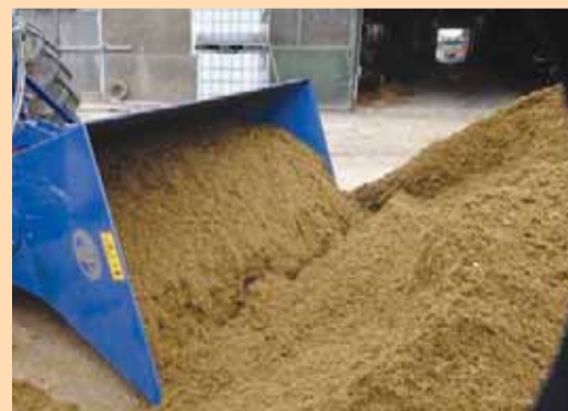
המפזרת החדשה. אפשר להעמיס מ-700 עד 1,300 קילוגרם

בימים אלה החלו בישראל השיוק והמכירה של AP Multi Divider, מפזרת רב-תכליתית מבית AP MACHINEBOU ההולנדית. המפזרת מיובאת לישראל על ידי י.ע.ר טכנולוגיות בע"מ. המפזרת תוצג בתערוכת החקלאות "יבול שיא" שתתקיים ב-4 בנובמבר במעיין חרוד.