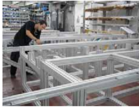
מפעל בקרה גבע.

בעשור האחרון לדבריו, הוא תהליך מדיגיטציה מאוד של מפעלים המעדיפים לפתח ולהשקיע בפעילותם דווקא בחו"ל ופחות