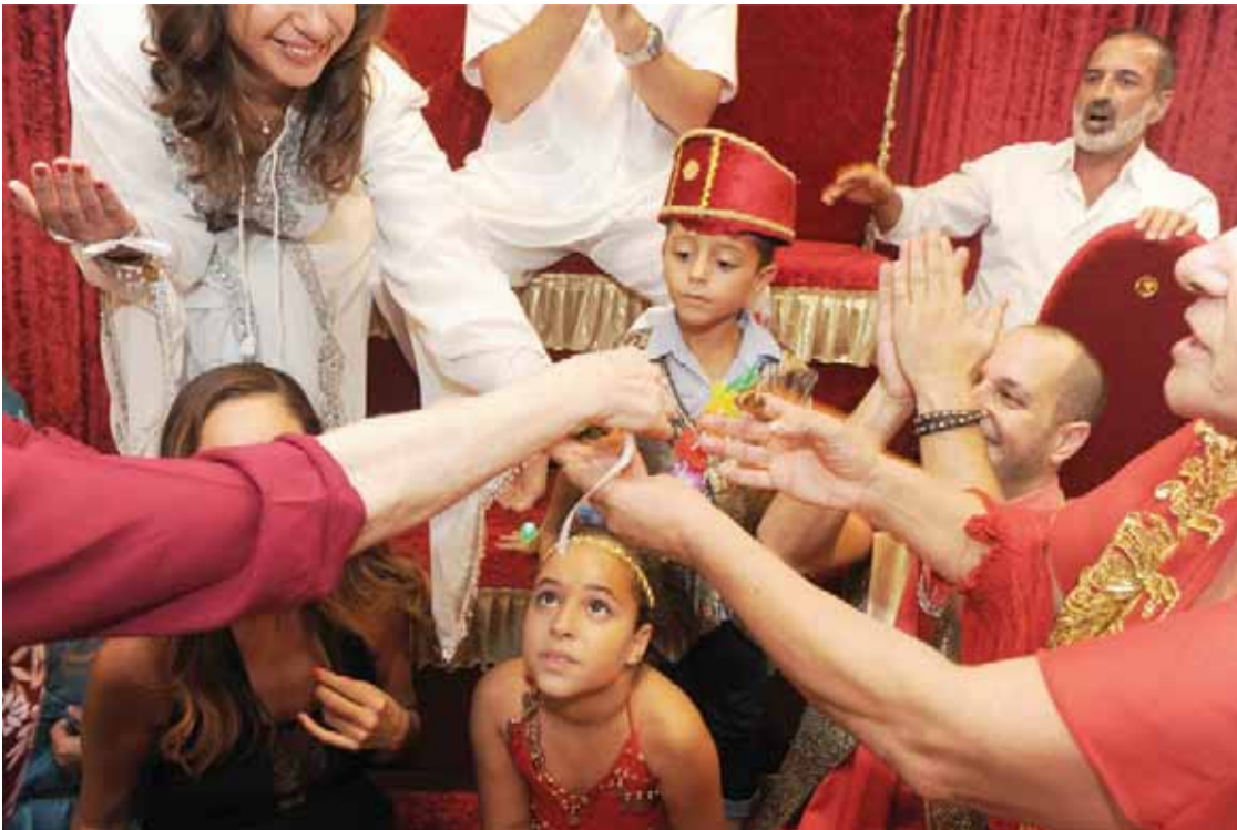
מצאה חינה בעינייה טקס חינה בעפולה ספטמבר 2014.