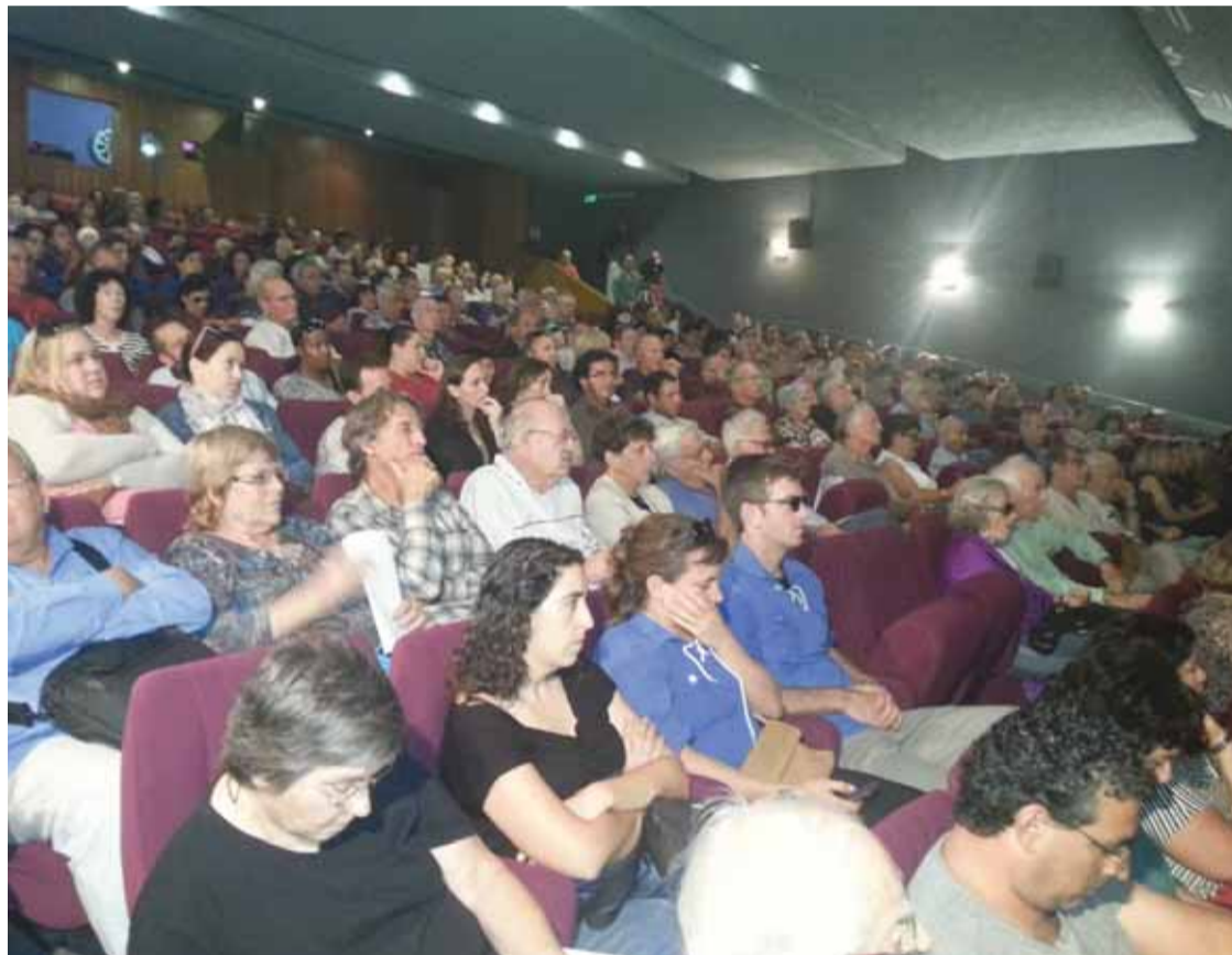
כנס המטה השיתופי במשמר העמק.

יוסי מקיבוץ סמר , קיבוץ שווינוני על גבול האנרכיסטי, הציג איזון אחר בין כלכלה לחברה הקיים בקיבוץ. לדבריו: "כלכלה היא מכשיר שנועד לקיים את הדבר הזה שנקרא קיבוץ, היא לא המ"טרה. אך מכיוון שהיבטים לשרוד, בסמר יש מרכז משק וגזבר. מנגד, מזכיר או