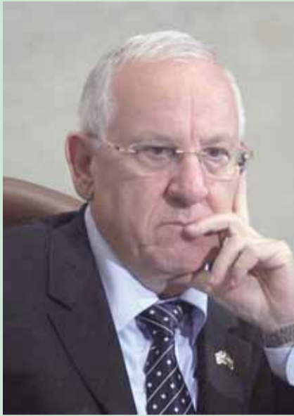
ריבלין. מעורר אכזבה עמוקה בימין.