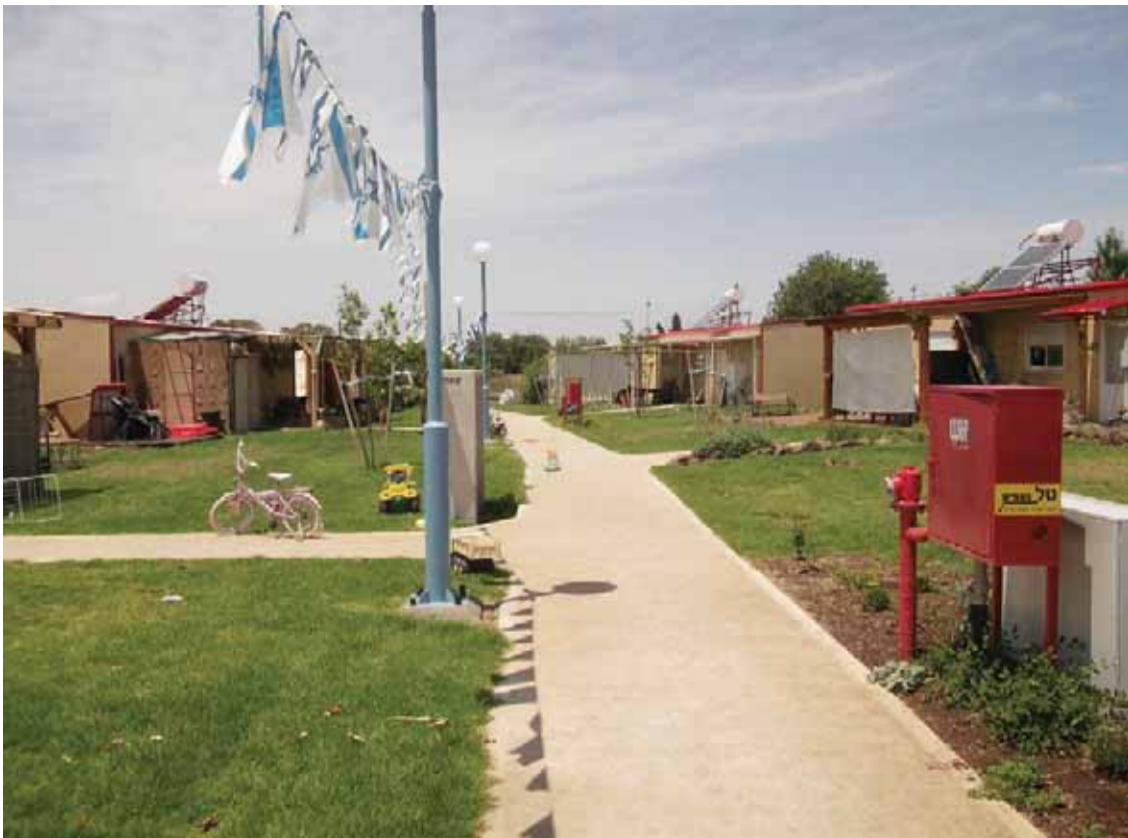
שכונת הקרוואנים. "סך הכול, בסוף אמורים להיות כאן 40 קרוואנים"