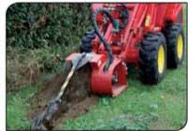
מתעל, חופר תעלות