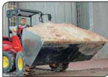
כף למיני מעמיס