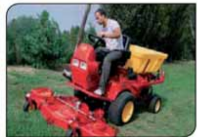
מכסחת PG דיזל עם תא מטען לגננים