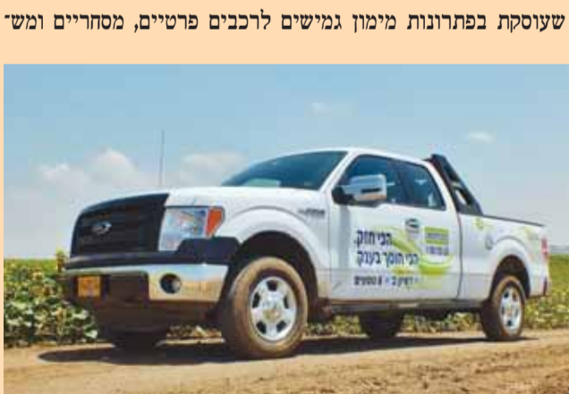
"פיק אפ" F-150 של פורד. ה"גולית" של הטנדרים

המודל המתקדם והחסכוני של FORD SUPERCAB F-150 יוצג בתערוכה במעיין חרוד