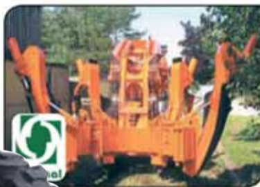
עוקרן לעקירת עצים