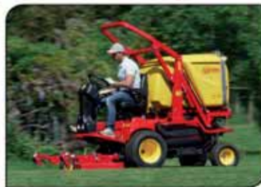
מכסחת עם איסוף בנפח 800 ליטר