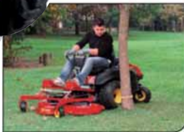
מכסחת רדיוס סיבוב 0