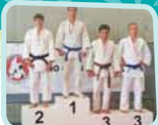
ימי שני וחמישי