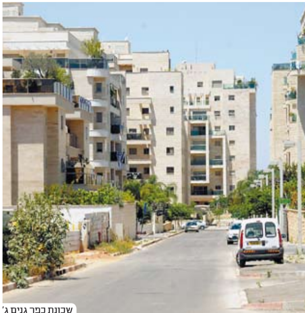
שכונת כפר גנים ג'

השכונה וגם במיילים על כך שהגיע הזמן שוועדי השכונות ישתפו פעולה. כולם אמרו שעיר זו לא מדינה, ושהבעיות שלה הן לא אותן בעיות שיש במדינה ולכן אין מקום למפלגות ולגופים שמייצגים סיעה כזו או אחרת ברמה הארצית."