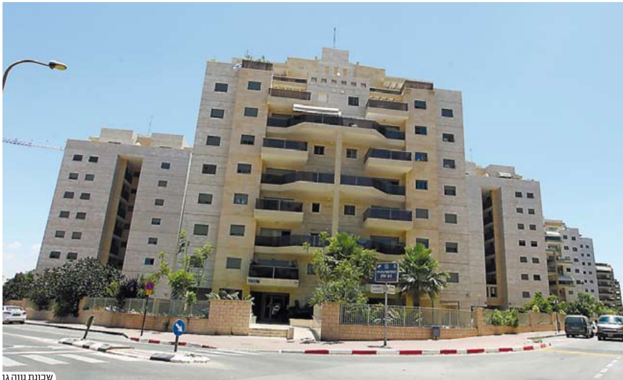
שכונת נווה גן