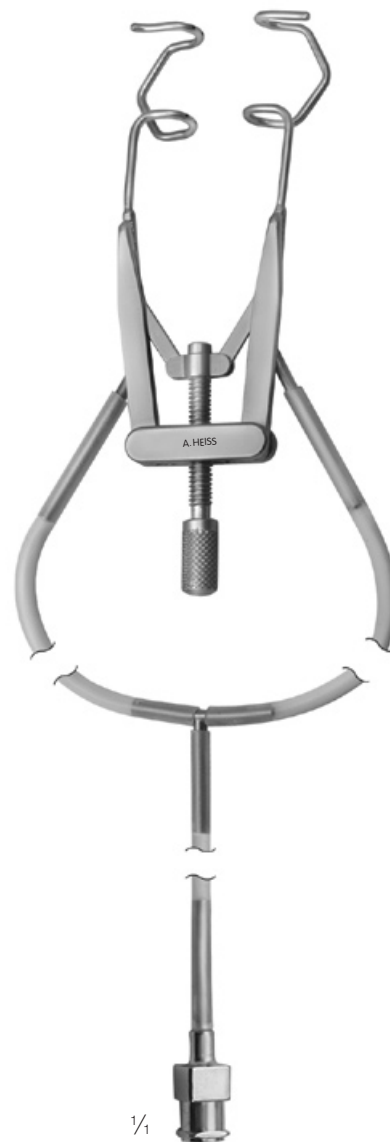
H-1021 Liebermann Lidsperrer mit Aspiration, V-wire Eye Speculum with Aspiration, V-wire Blefaróstató con Aspiración, V-wire Blépharostat avec aspiration, V-wire