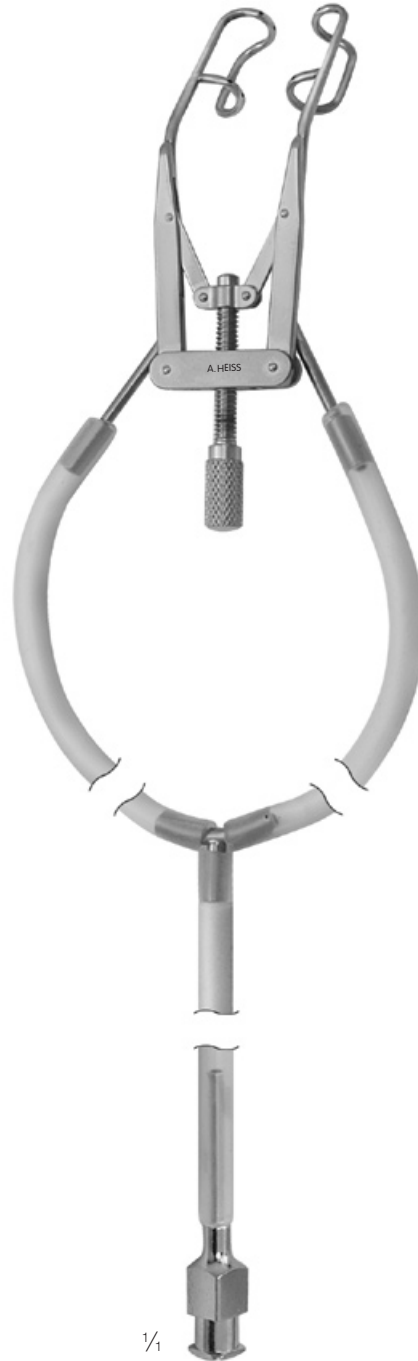
H-1022 Wiltfang Lidsperrer mit Aspiration Eye Speculum with Aspiration Blefaróstato con Aspiración Blépharostat avec aspiration