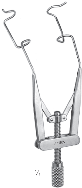
H-1052 Liebermann Lidsperrer, K-wire Eye speculum, K-wire Blefaróstato, K-wire Blépharostat,, K-wire