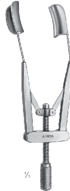
H-1054 Liebermann Lidsperrer, volle Blätter Eye speculum, solid blades Blefaróstato, macizo Blépharostat, plein