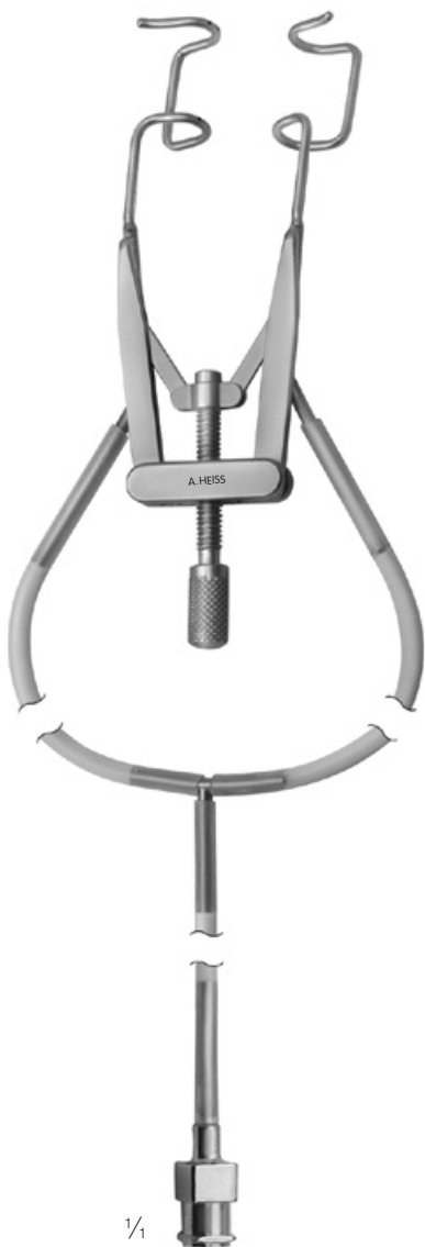
H-1020 Liebermann Lidsperrer mit Aspiration, K-wire Eye Speculum with Aspiration, K-wire Blefaróstató con Aspiración, K-wire Blépharostat avec aspiration, K-wire