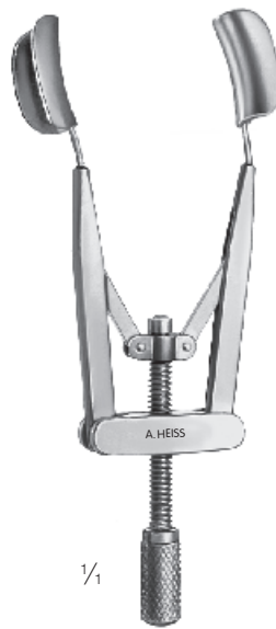
H-1057 Kershner Lidsperrer, volle Blätter Eye speculum, solid blades Blefaróstato, macizo Blépharostat, plein