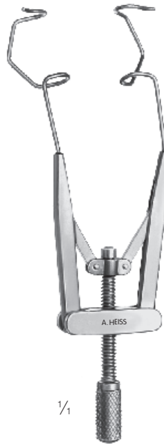
H-1053 Liebermann Lidsperrer, V-wire Eye speculum, V-wire Blefaróstato, V-wire Blépharostat,, V-Wire