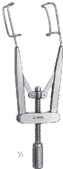
H-1056 Kershner Lidsperrer, gefenestert Eye speculum, fenestrated Blefaróstato, fenestrado Blépharostat, fenêtré